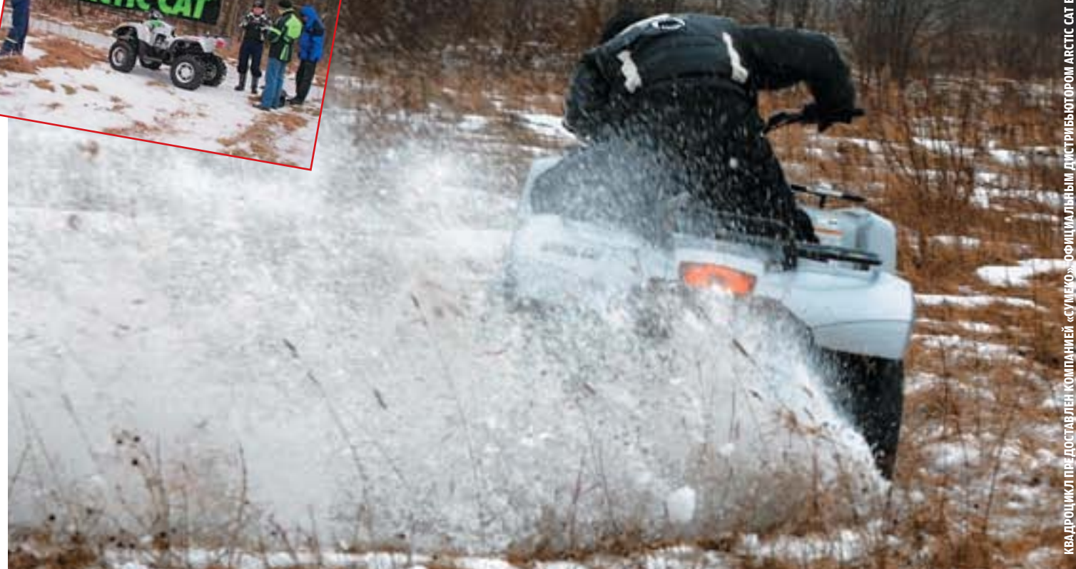
КВАДРОЦИКЛ ПРЕДОСТАВЛЕН КОМПАНИЕЙ «СУМЕКО» — ОФИЦИАЛЬНЫМ ДИСТРИБЬЮТОРОМ ARCTIC CAT В РОССИИ.